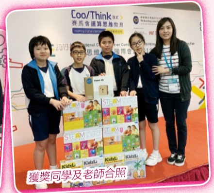
獲獎同學及老師合照