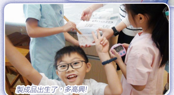
製成品出生了，多高興！