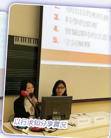
以行求知分享實況