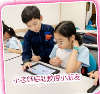
小老師協助教授小朋友