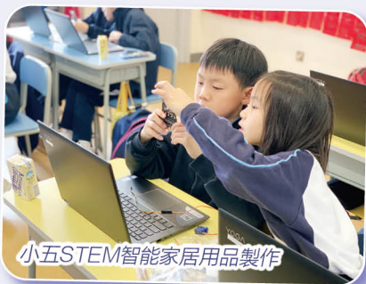
小五STEM智能家居用品製作