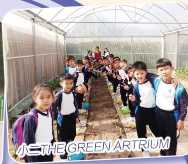
小三THE GREEN ATRIUM