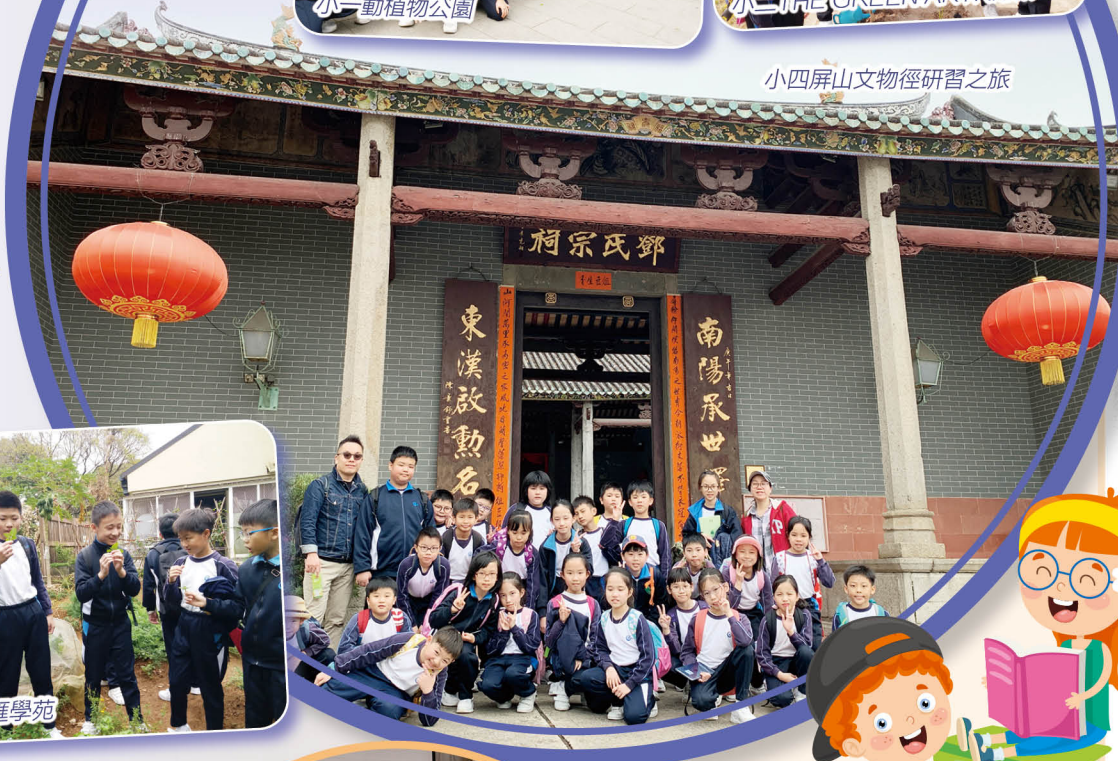
小四屏山文物徑研習之旅