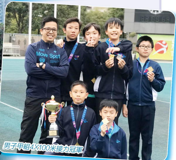
男子甲組4x100米接力冠軍