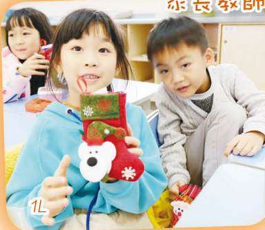
宗長教師會致送禮物給學生

12月21日早上，本校亦舉行了「學生匯演」，內容有唱詩敬拜、家教會就職典禮和學生表演。學生的表演十分精彩，包括有西方舞蹈表演、中詩集誦、手鐘手鈴演奏、歌詠、芭蕾舞和小一表演等。