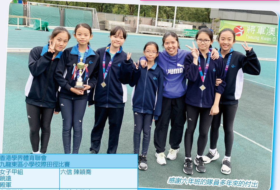
感謝六年班的隊員多年來的付出