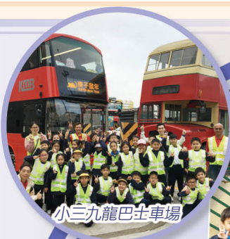
小三九龍巴士車廠

「綠匯學苑」前身為舊大埔警署，並獲評為一級歷史建築，現以「推廣永續生活」為目標。學生透過親手採集食材、低碳烹飪、惜食體驗等活動，認識低碳飲食、永續生活的原則。