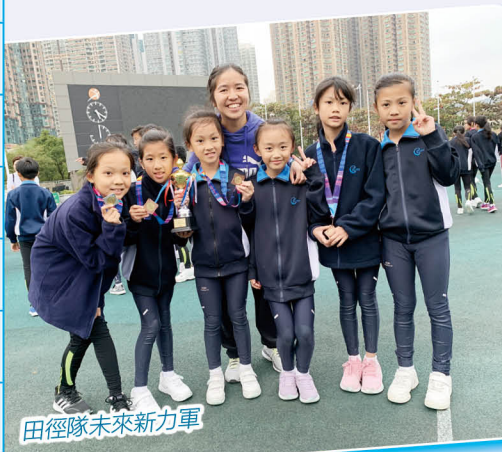
田徑隊未來新力軍