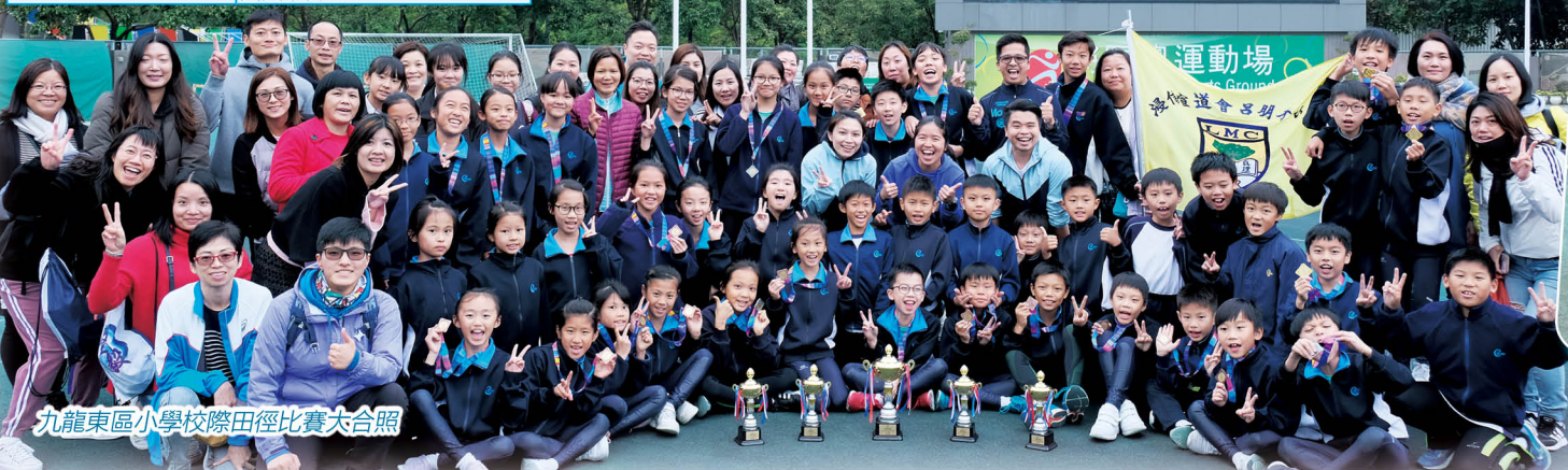
九龍東區小學校際田徑比賽大合照