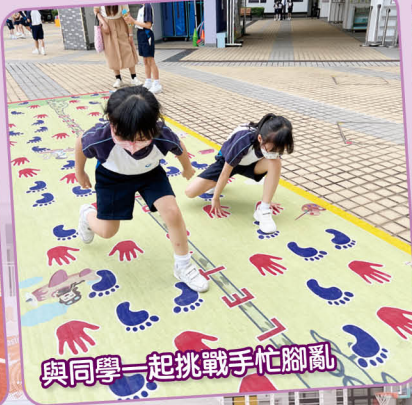
與同學一起挑戰手忙腳亂