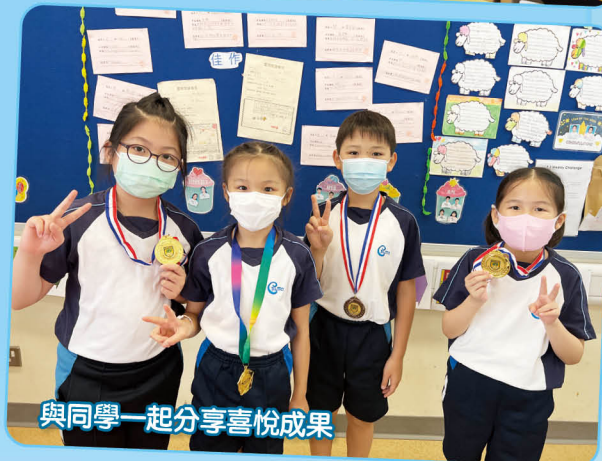
與同學一起分享喜悅成果