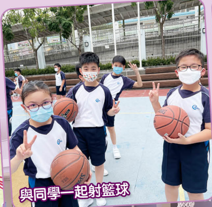
與同學一起射籃球