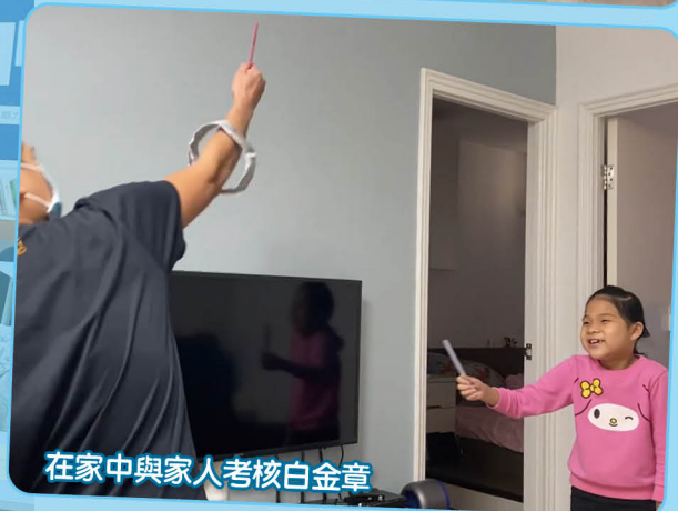
在家中與家人考核白金章