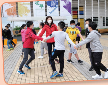
聖誕聯歡會當天老師和同學於操場跳聖誕舞

往年聖誕節前，本校的全校老師、同學及家長會一同在操場跳聖誕舞，雖然今年因疫情關係未能邀請家長到校參與，但為了讓同學能感受聖誕節的歡樂，我們在聖誕聯歡會當天安排全校老師和同學一同於操場舞動一番。此外，同學們亦將跳聖誕舞的特色活動帶到家中，於聖誕假期間在家中與家人一起跳聖誕舞，並拍攝成短片，將運動的氣氛及歡樂延展到家庭中。