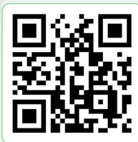
5L 溫嵐作品及影片分享