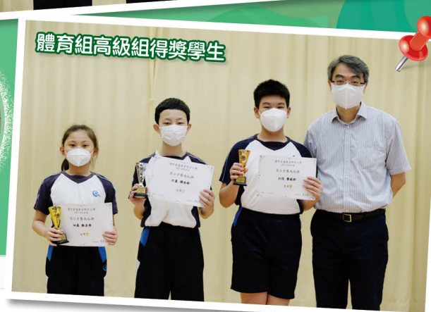
體育組高級組得獎學生