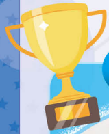
語言藝術得獎學生