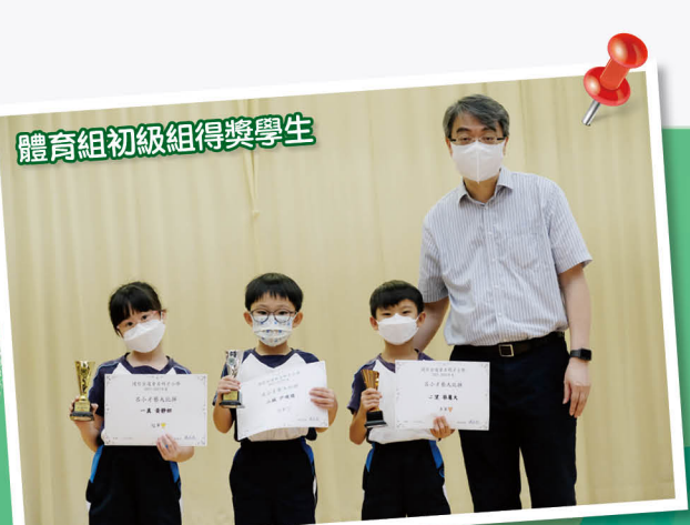
體育組初級組得獎學生