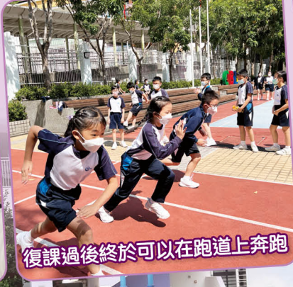
復課過後終於可以在跑道上奔跑