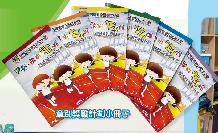
章別獎勵計劃小冊子

為了讓同學能夠保持恆常的運動習慣，積極參與體育活動，並期望同學能將運動習慣擴展至家庭成員，達到「運動就是健康」的小學校園計劃。