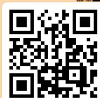
1S 關本恩作品及影片分享