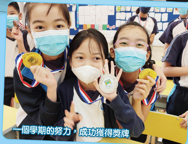
一個學期的努力，成功獲得獎牌