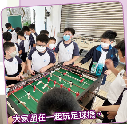
大家圍在一起玩足球機，真快活！

同學在疫情期間長居家中，為了讓同學輕輕鬆鬆適應停課後的校園生活，我們舉辦了「特惠大息大放送」，每一日安排一樓層的同學可以到操場進行特惠大息(時間為 45 分鐘)，活動包括：最受歡迎的跑步、「手忙腳亂」、「體能般」活動、足球機、羽毛球和籃球等，讓同學在校園可以舒展筋骨。同學們見到與他們熟悉的老師一同活動顯得特別開心。