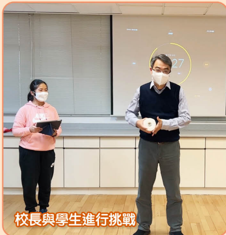
校長與學生進行挑戰

疫情期間，停課不斷，為了激發同學參與運動的興趣，我們舉辦了「網上師生體能挑戰賽」，由老師進行一些簡單的體能活動，讓同學在家中進行挑戰。同學見到自己親愛的老師，甚至校長也粉墨登場，一同參與挑戰，都表現得非常興奮和踴躍，最重要是能增進師生關係。此外，挑戰賽其中一個項目是需要二人小組進行，因此同學需要邀請家人一同參與，這樣不但能增強親子之間的互動，還能把運動氣氛延伸至家中。