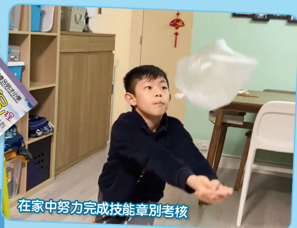
在家中努力完成技能章別考核