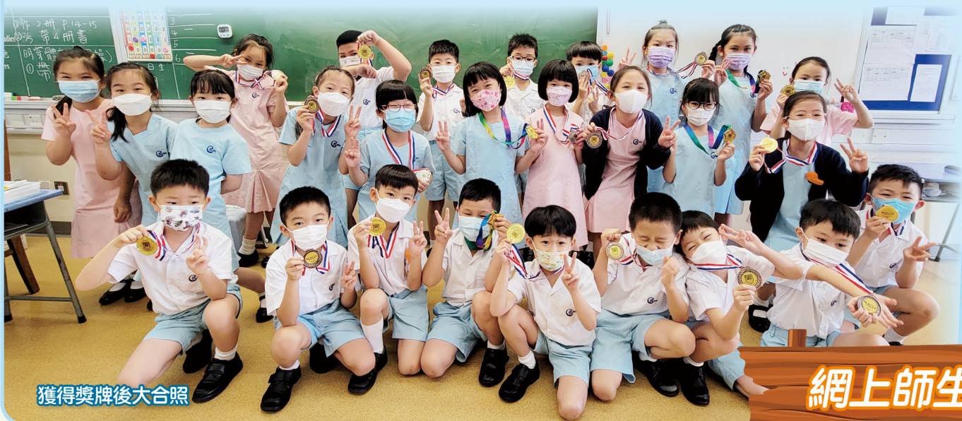
獲得獎牌後大合照