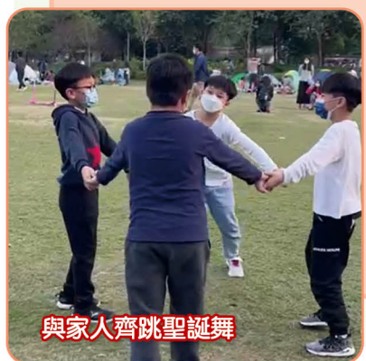
與家人齊跳聖誕舞