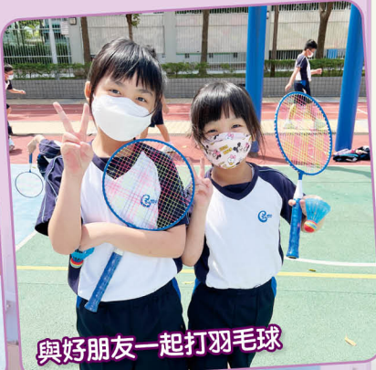
與好朋友一起打羽毛球