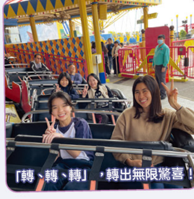
「轉、轉、轉」，轉出無限驚喜！