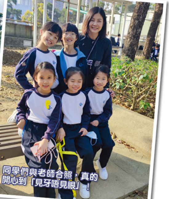
同學們與老師合照，真的開心到「見牙唔見眼」！