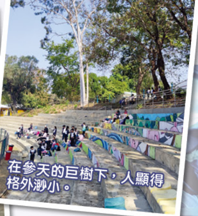
在參天的巨樹下，人顯得格外渺小。