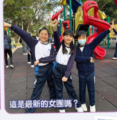
這是最新的女團嗎？