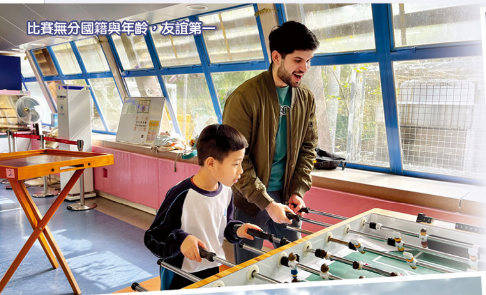
比賽無分國籍與年齡，友誼第一