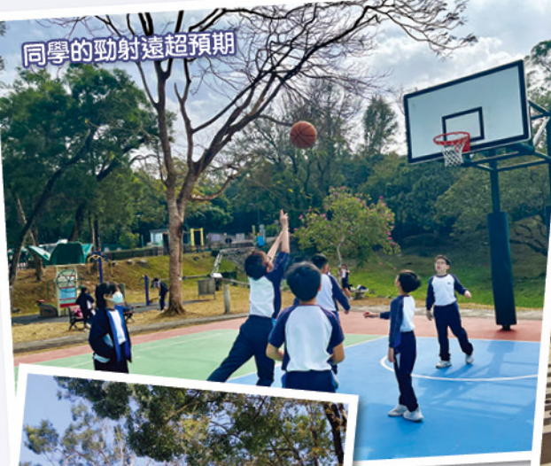
同學的勁射遠超預期