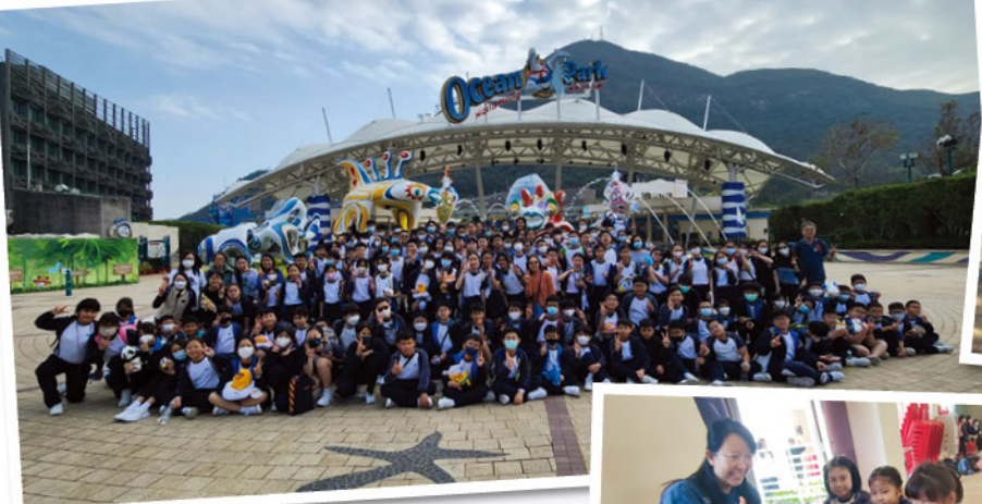
海洋公園！我們再來了