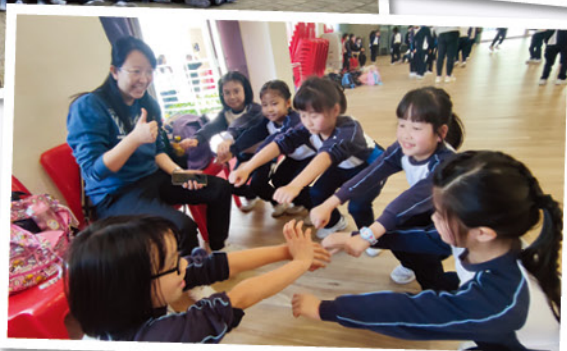
比一比，誰的耐力最高？