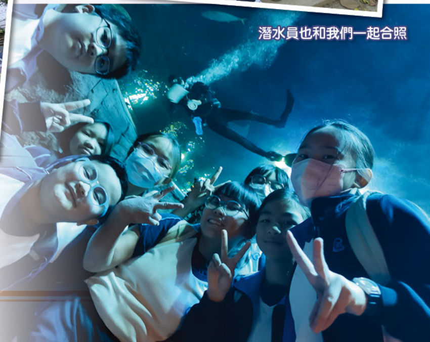
潛水員也和我們一起合照